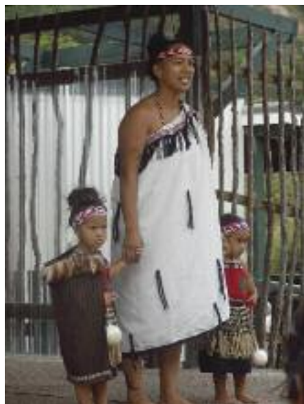
Rotorua - Nouvelle Zélande