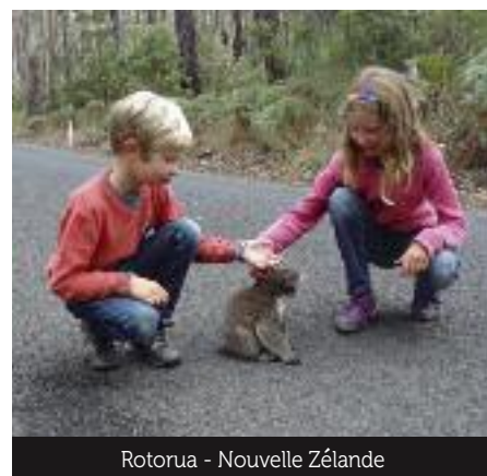
Rotorua - Nouvelle Zélande

Petite contrariété : si nous avons été totalement épargnés par la maladie jusqu'alors (excepté un rhume), les