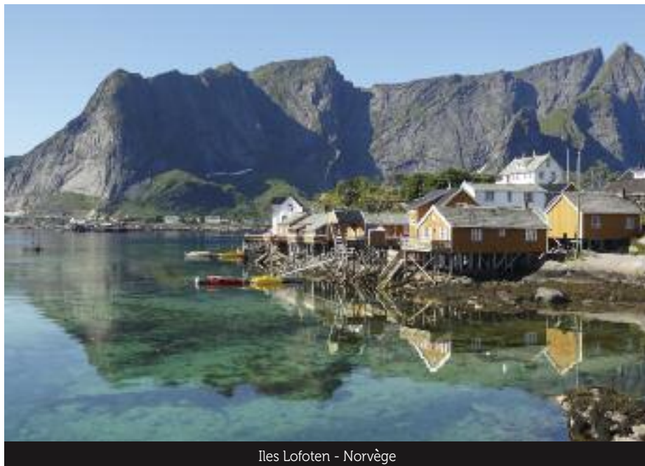
Iles Lofoten - Norvège