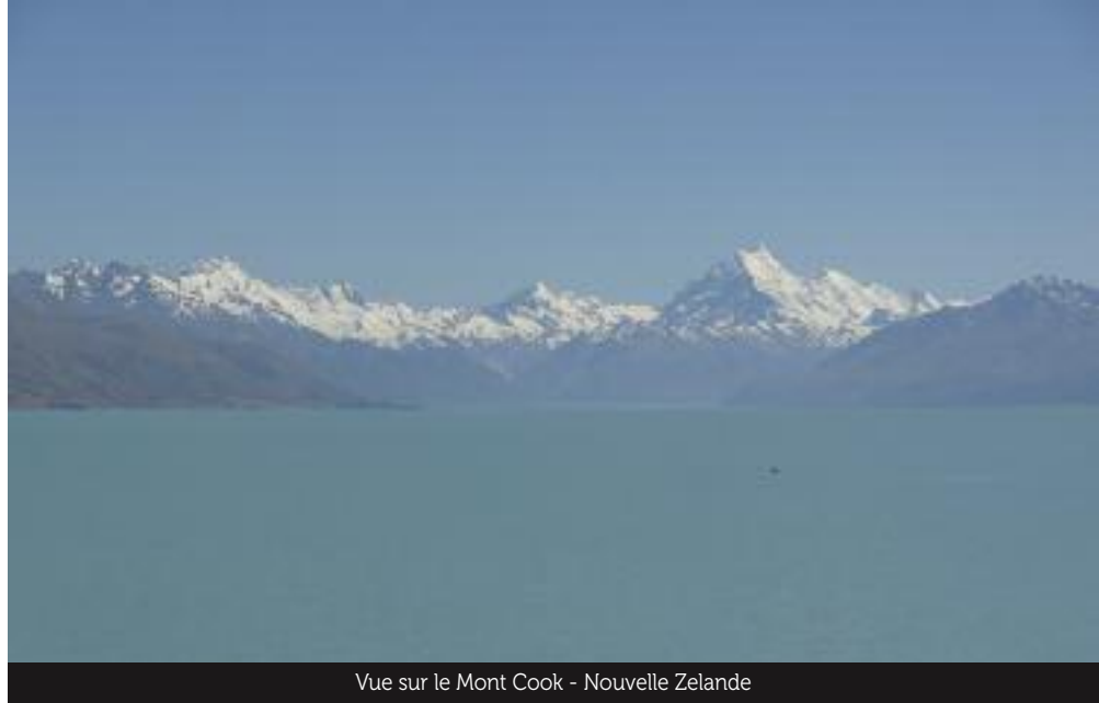
Vue sur le Mont Cook - Nouvelle Zelande

Nous avons prévu deux mois et demi sur place mais découvrons vite qu'il faudrait dix fois plus de temps pour avoir un aperçu conséquent de l'île continent, grande comme 14 fois la France (et 3 fois moins peuplée...).