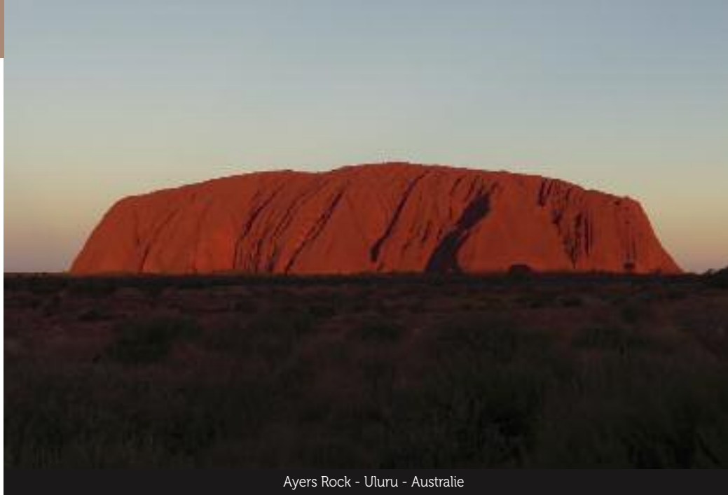
Ayers Rock - Uluru - Australie

Les enfants, qui s'étaient bien habitués à travailler quelques heures par semaine sous la houlette de leur maman et en s'adaptant aux circonstances (et au mobilier disponible...) ont repris le chemin de l'école avec beaucoup d'enthousiasme et, semble-t-il, de réussite.