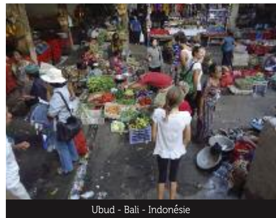
Ubud - Bali - Indonésie

Une grande envie d'entreprendre, qu'il s'agisse d'une nouvelle activité professionnelle pour l'un ou d'un atelier théâtre novateur à destination des petits Feucherollais pour l'autre.