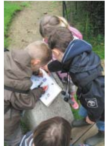
Jeu en équipe, recherche sur les espèces menacées