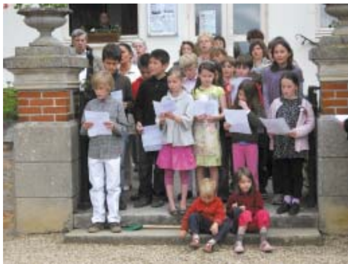
Cérémonie du 8 mai : Les enfants des écoles et la chorale du C.A.M.