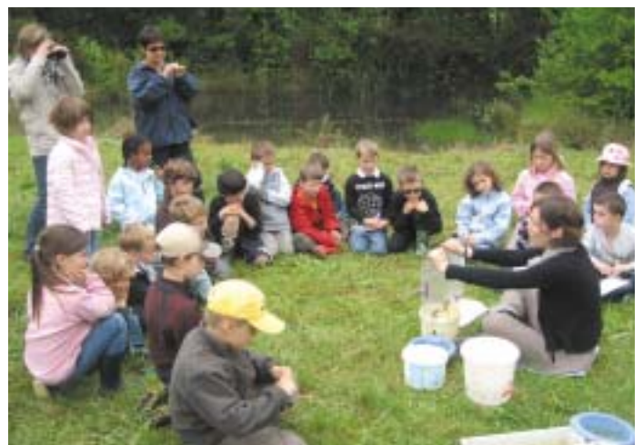
Les petites bêtes