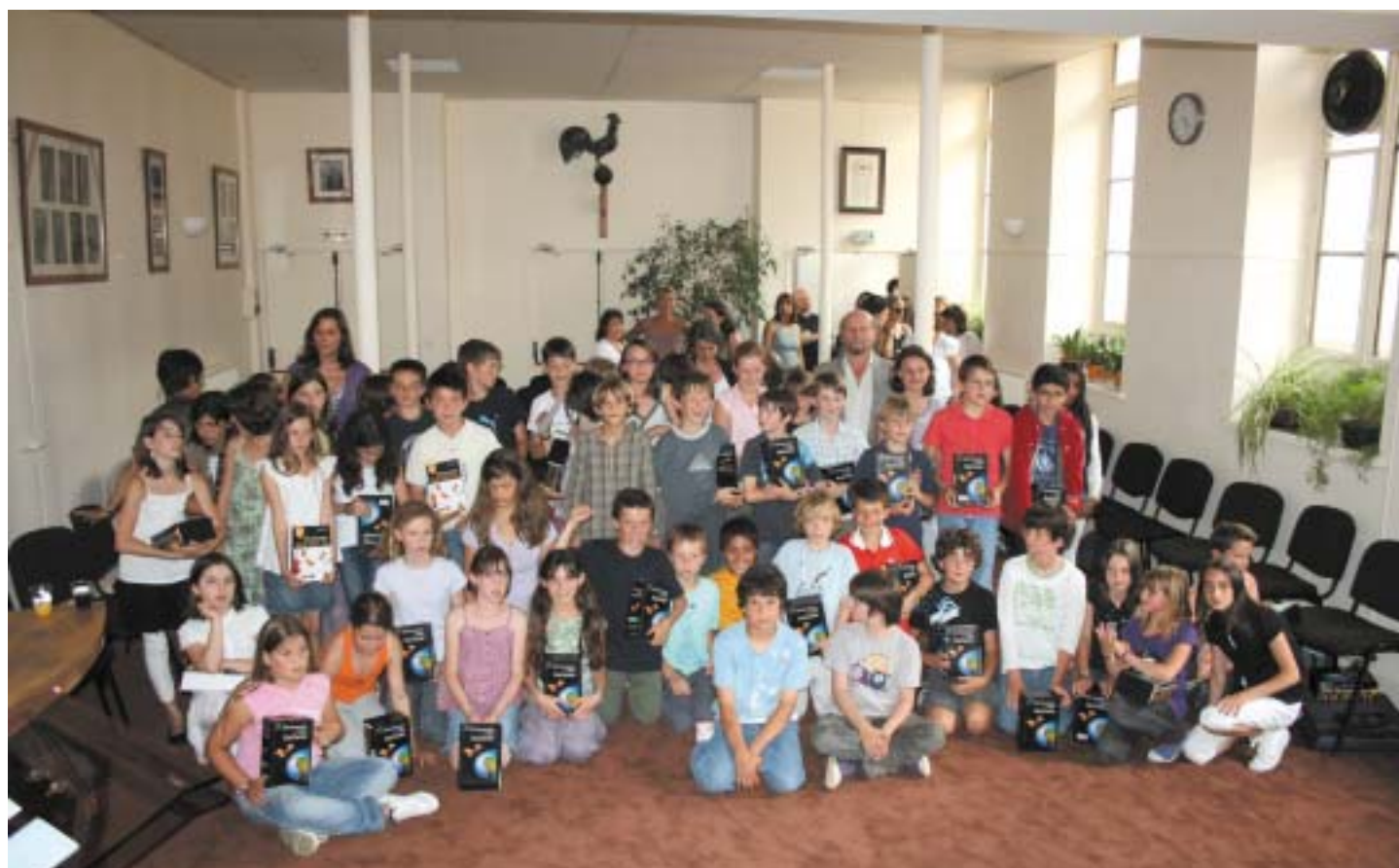
Remise des dictionnaires aux CM2 : 25 juin