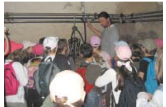
Visite de la ferme bio