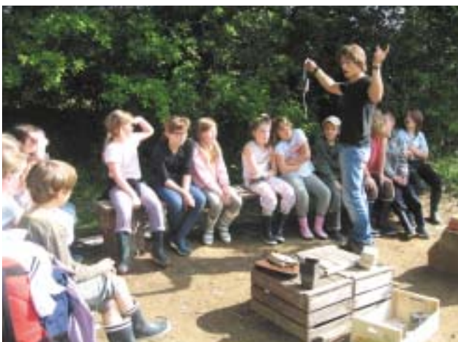
Fabrication d'une maison écologique