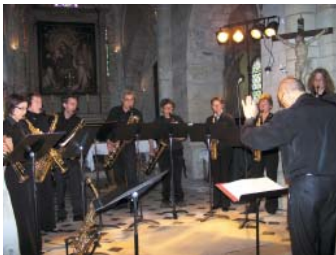
17 mai : Concert et découverte du saxophone organisé par l'association "jazzafeuch" avec le groupe Saxomania.