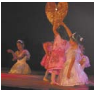
Fête de la Danse : 20 juin