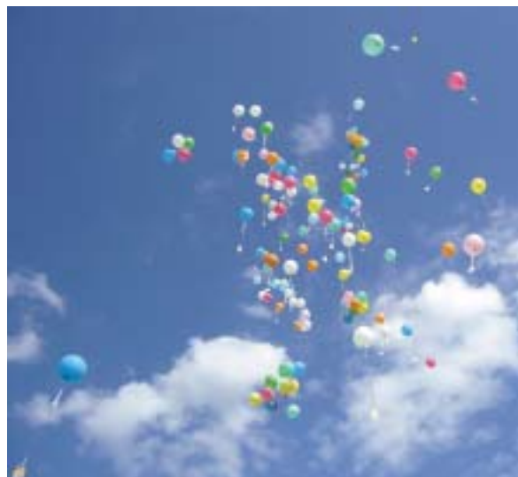
Fête des enfants le samedi 13 juin : Nous avons reçu, en mairie, des étiquettes attachées aux ballons. Le vent les a transporté jusqu'à la Marne (Département 51).