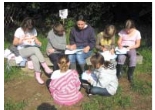
Jeu dans le potager