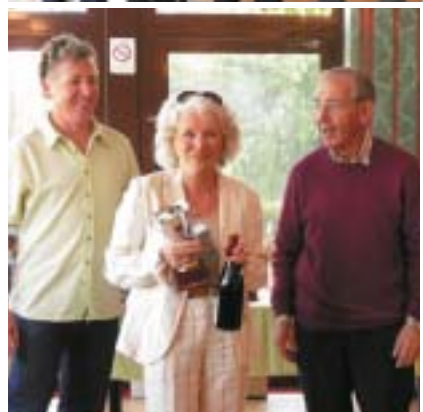
Coupe de golf du Pays de Gallie le 17 mai : cette coupe n'a pas dérogé à la tradition et a réuni jeunes et moins jeunes golfeurs de Feucherolles, Chavenay, Crespières et Saint-Nom-la-Bretèche, ainsi que nos amis golfeurs de Rösrath.