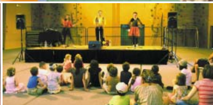
Spectacle de "Roger Cactus"