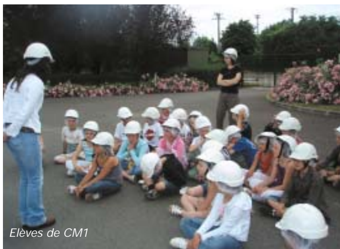
Elèves de CM1

Le 27 juin dernier, les élèves de CM1 et de CM2 de l'école "La Trouée", sont repartis sur les chemins de la découverte et de l'apprentissage. Dans le cadre de leur programme de sciences, et afin d'asseoir leurs connaissances sur un sujet aussi important et vital que celui de l'eau, une visite a été organisée par leurs maîtresses au sein de la station d'épuration du SIAVV à Verneuil-sur-Seine.