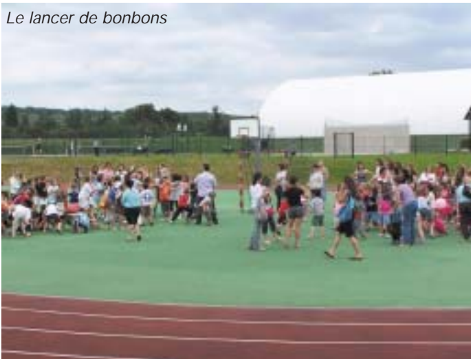
Le lancer de bonbons

VOS RENDEZ-VOUS AVEC CE NUMÉRO DE LA VIE AU VILLAGE :