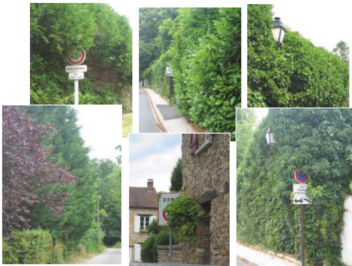
Cherchez panneaux et candélabres...

Afin de remédier à ceci, il a été décidé de procéder à une campagne en plusieurs étapes :