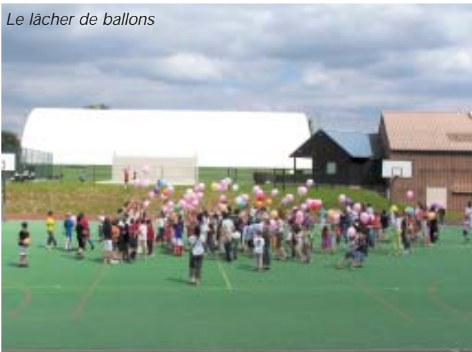
Le lâcher de ballons

comme à son habitude bien coloré, avec des "oh !" d'exclamation dès que ceux-ci prirent leur envol ! Une dernière surprise devait tous nous réjouir, notamment les plus gourmands, celui du lancer de bonbons, qui fit le bonheur des plus petits mais aussi des plus grands !