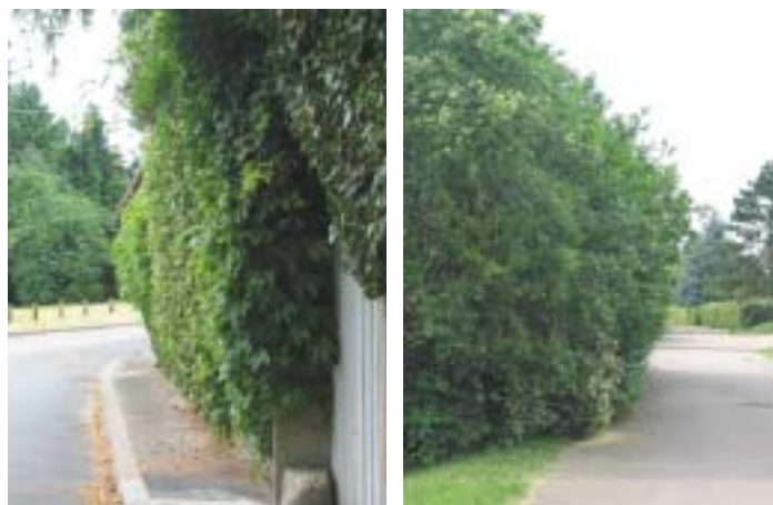
Trottoir pour personnes de très petite taille