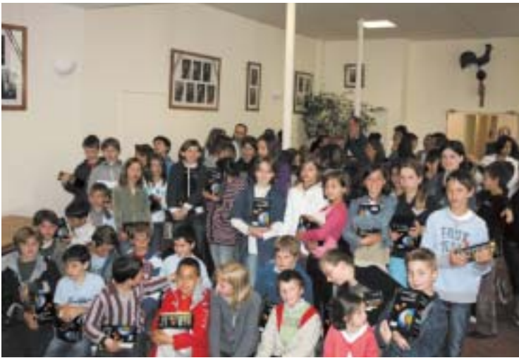
Les élèves de CM2 des écoles primaires La Trouée et B. Deniau