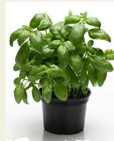
Barod i'w hel

Os bydd blodau'n ymddangos, tynna nhw ar unwaith i annog dail i dyfu.