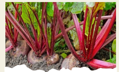
Barod i'w codi

Paid â gadael i'r planhigion bach a godaist ti wrth deneuo fynd i wast. Gelli di eu bwyta nhw mewn salad ac maen nhw'n cael eu galw yn 'microgreens'.