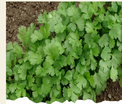
Barod i'w hel