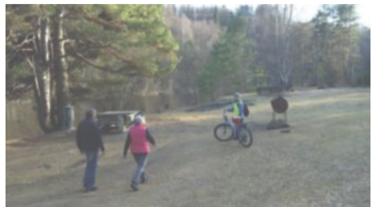
IDYLLISK RASTEPLASS: Dette er den ytterste rasteplassen på Hovsenga, et godt egnet sted for hvile og grilling.

På tur tilbake bør du benytte snarveien som Hovsengas Venner opparbeidet i 2013. Den svinger av i åkerkanten til venstre i bunnen av bakken. Et lite stykke før du kommer inn i Bekkegata, er stien smal og umulig å sykle. Veien tilbake følger nå Ullerålskata og gangstien mot Glatved brygge.