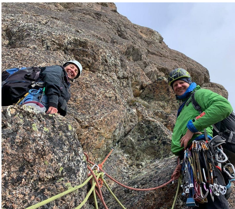
Klatring på Skurvefjell på BC Hemsedal, 2020

Årsmøtet sendes digitalt via Teams fra Friluftslivets hus i Tverrgaten 4-6, kl.18.00 onsdag 03.februar 2021