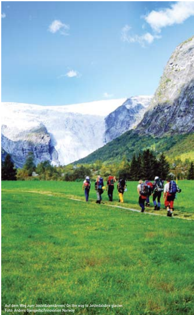
Auf dem Weg zum Jostedalensbreen/ On the way to Jostedalsglacier.