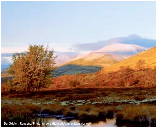
Dorråldalen, Rondane.

The common right of access gives everyone the right to roam in Norway's nature