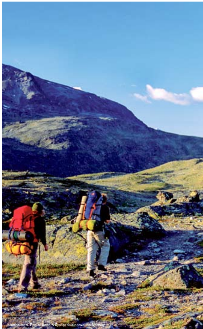
Jotunheimen, Photo: Anders Gjøgedal/Innovation Norway