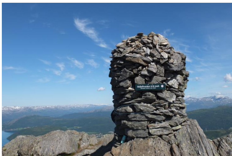
Varden på Stortuva – Øyfellvarden 818 moh

I dag går det en sti opp Trongskaret til Øyfjellet (Stortuva) i ulendt steinet terreng. Prosjektgruppa ønsker å tilrettelegge på en betydelig bedre måte ved å opparbeide trinn av eksisterende stein i Trongskaret, slik at flere kan benytte seg av fjellet og den omkringliggende natur på en lettere og tryggere måte.