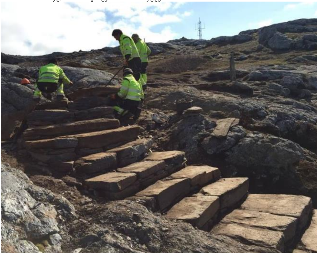
Sherpa i arbeid med steintrapp opp mot Keiservarden i Bodø

Stien er tenkt bygd av sherpa gjennom Stibbyggjaren AS.