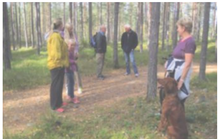
FLATT OG FINN: Mange benytter seg av de fine turmulighetene på Kilemoen.