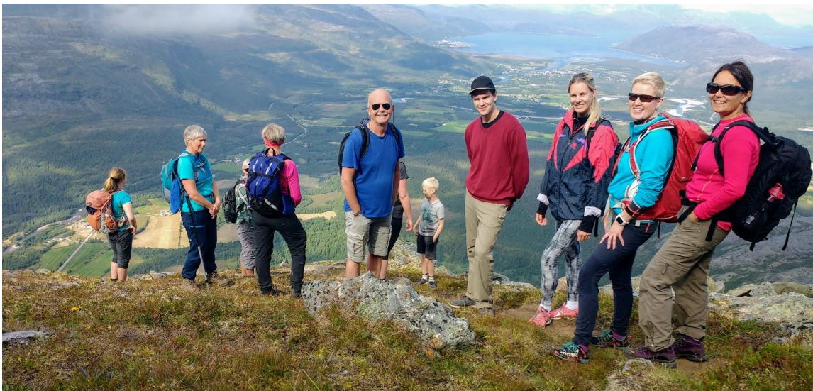
Toppen nærmer seg og utsikten over blir bedre og bedre. Reisafjorden i bakgrunnen.

I september arrangerte NTT topptur til Storeste, som ligger 1024 meter over havet. Tolv deltakere gjorde at turen var fullbooket. Turen ble ledet av Bodil Bråstad.