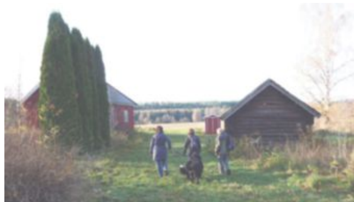
OVER TUNET: Dette er den gamle husmannsplassen Slepå.

men i bunnen av den andre kneika, tar vi inn i skogen på en tydelig sti. Rett ved stien er det registrerte rester etter dyregraver. Vel 50 meter lenger framme svinger den markant