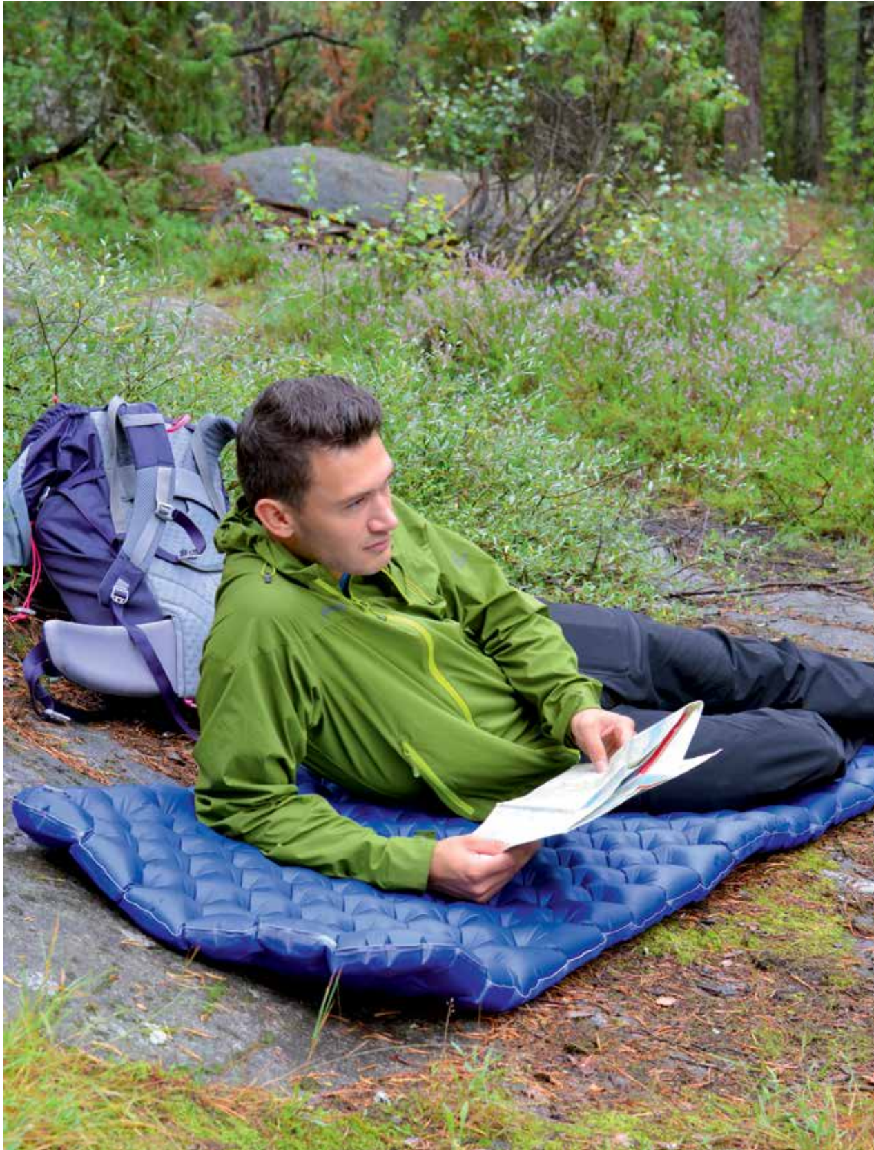
LIGGER GODT: Med et solid liggeunderlag blir teltturen straks mye mer behagelig.