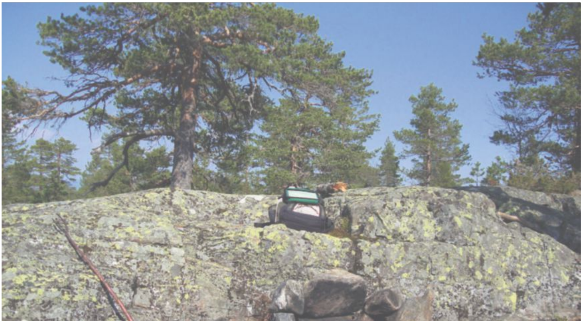
TOPPTUR: Det er fint å raste på toppen av Gunhildåsen.