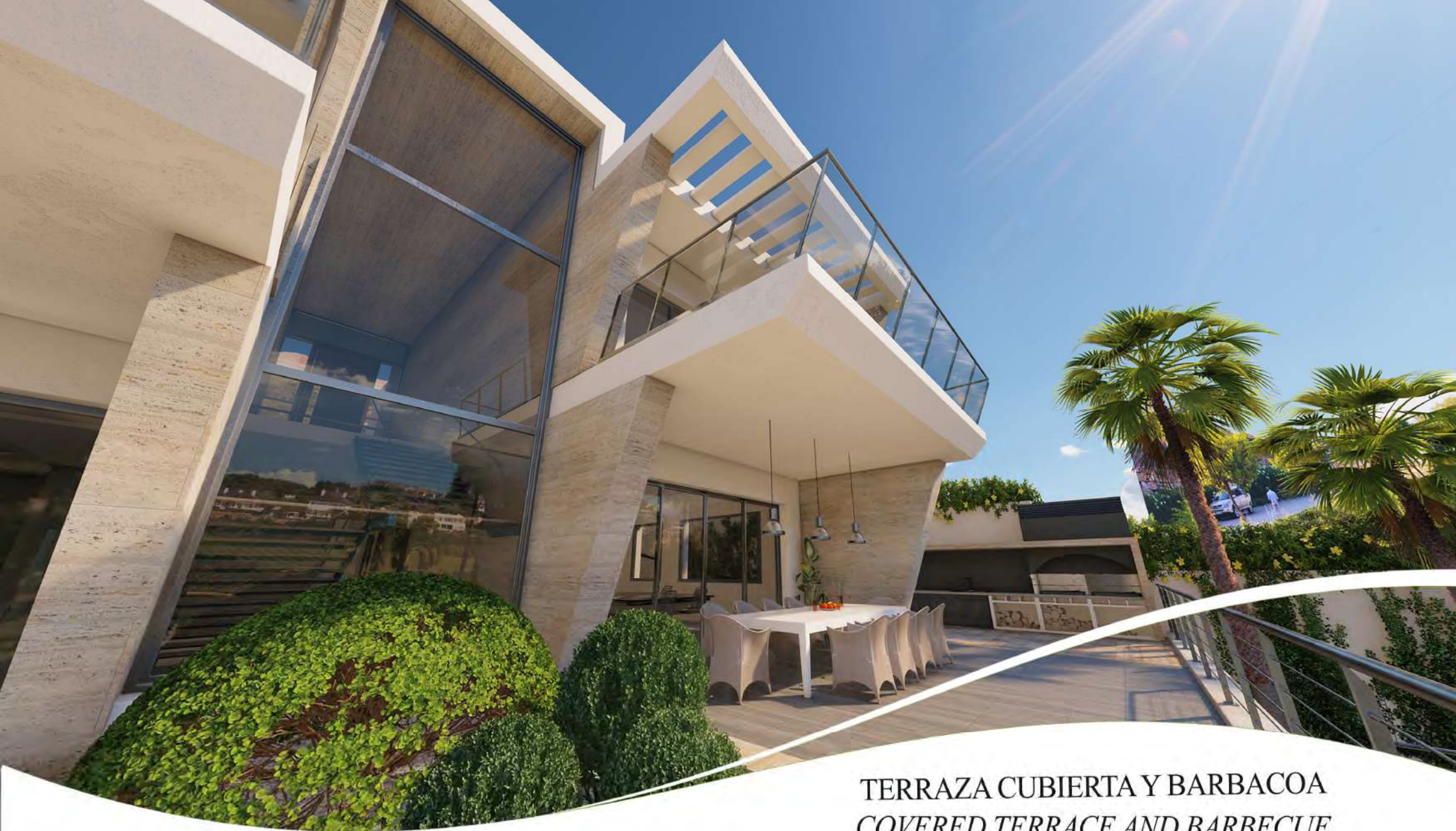
TERRAZA CUBIERTA Y BARBACOA COVERED TERRACE AND BARBECUE