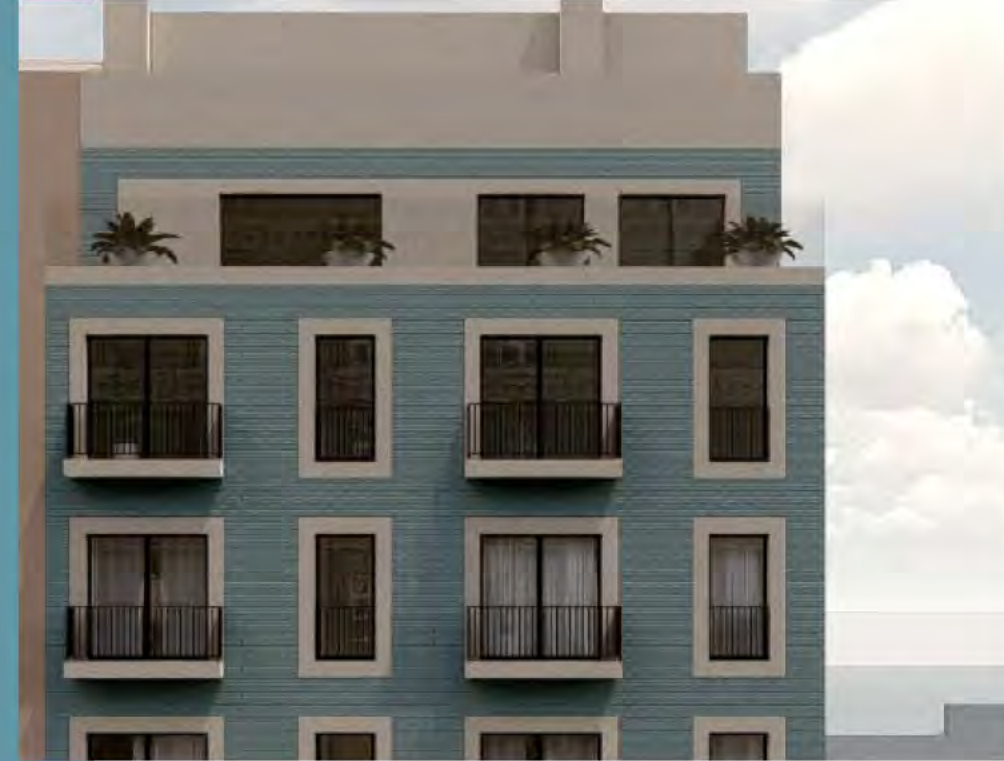
Lirio, 11 Valencia

22 APARTAMENTOS DE CORTA ESTANCIA RESULTADO DE UNA OBRA NUEVA SOBRE EDIFICIO INDUSTRIAL, EN UNA DE LAS ZONAS EN EXPANSIÓN DE VALENCIA