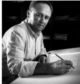
Luis Pedro Moreira Arquitectura y Diseño