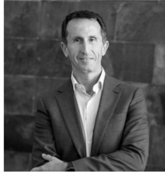
Jose Castellano Construcción