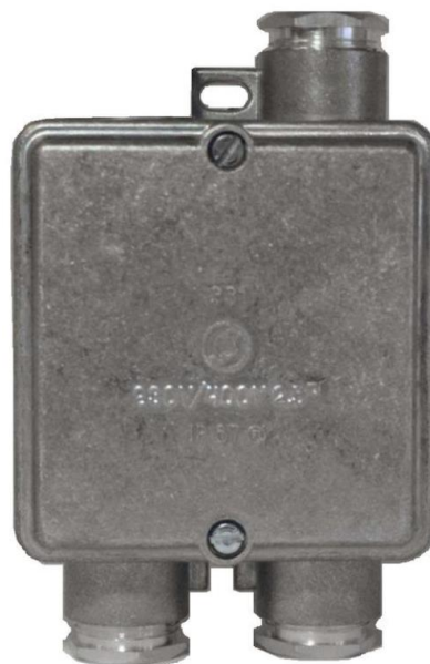
Kuva 2 Liitosrasia Snro: 16 237 55

Tuotenimi: Jakorasiasia 2,5mm IP67 3xPK16 Sähkönumero: 16 237 55