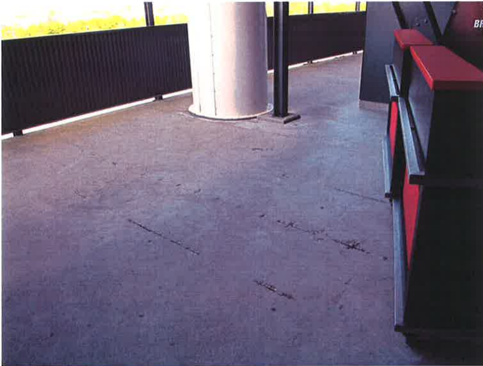
Foto 3: Wapeningscorrosie in de bovenzijde van bordes tussen twee trappenhuisen (nabij spant 113)