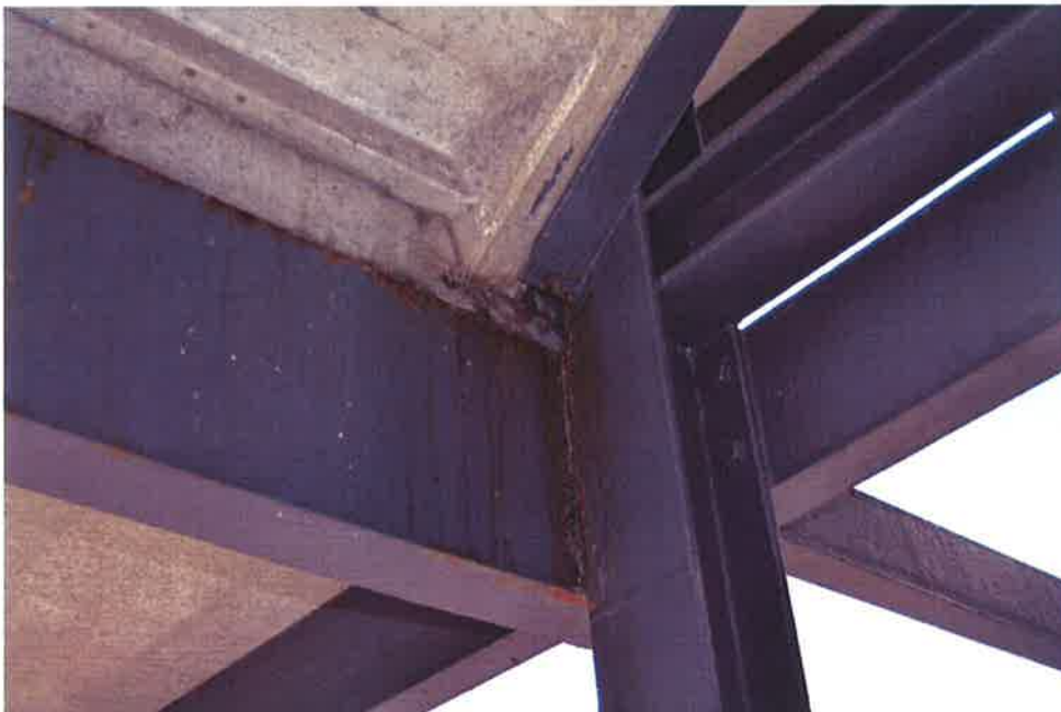
Foto 4: Corrosie in complexe aansluitingen in het trappenhuis (nabij spant 76)