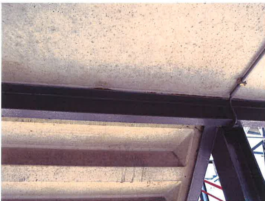
Foto 1: Corrosie van staalprofielen ter plaatse van oplegvlak van bordes (nabij spant 76)