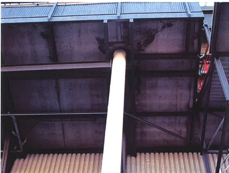
Foto 2: Watervoerende scheuren in bordes tussen twee trappenhuizen (nabij spant 4)