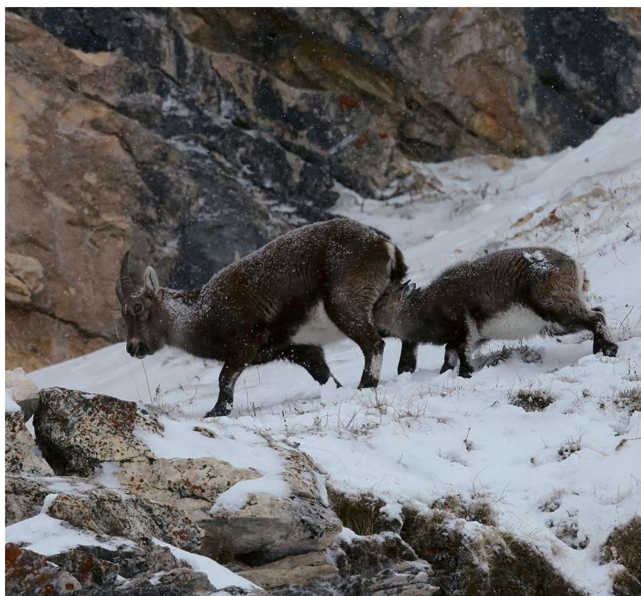
Dieses Steinbock kann auf eine starke, fürsorgliche Mutter zählen.