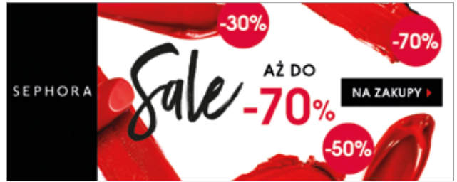
○ Rys. 5. Baner sklepu z kosmetykami komunikujący promocję, rozmiar 750 x 300

W dobie natłoku informacji reklamodawcy sięgają po wszelkie metody, aby zwrócić uwagę użytkownika. Z pomocą przychodzą innowacje technologiczne, również te, które wykorzystywane są przy tworzeniu kampanii reklamowych.