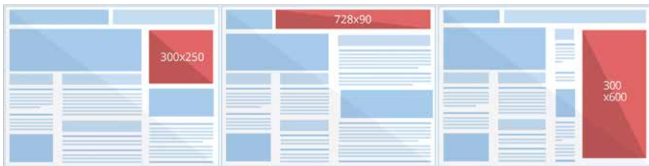
● Rys. 1. Google AdSense Top performing sizes – https://support.google.com/adsense/answer/6002621?hl=en

natomiast inwestują już 12 mld euro rocznie w performance marketing. Rozwijające się możliwości technologiczne nie tylko pozwalają użytkownikom coraz skuteczniej bronić się przed reklamami. Reklama internetowa daje także możliwość dokonywania bardzo dokładnych pomiarów efektywności , dzięki czemu mamy coraz większe możliwości precyzyjnego dotarcia do grupy docelowej i tym samym zwiększenia skuteczności naszych kreacji. I choć kampanie internetowe stają się coraz bardziej zautomatyzowane, wykorzystują skomplikowane algorytmy czy machine learning, to zaprojektowanie odpowiedniej kreacji wciąż jest domeną człowieka .