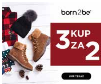
○ Rys. 3. Baner 300 x 250 marki fashion. Jasna, zwięzła komunikacja promocji, wyraźne CTA

będącą odpowiednikiem programu Photoshop (wymaga on jednak większego zaawansowania).