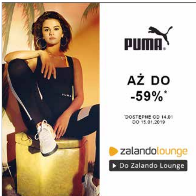
○ Rys. 2. Baner klubu zakupowego – atrakcyjne zdjęcie i wyraźna komunikacja korzyści