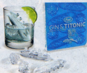
Une création du DA de Fred and Friends.