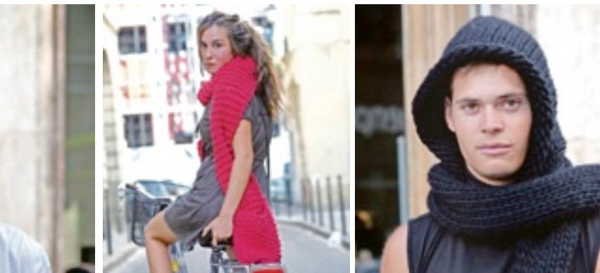
Ob Mütze oder Schal, Wool and the Gang sorgt in der Eiszeit für etwas Wärme.