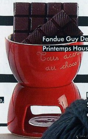
Fondue Guy Degrenne, 19,90 €, Printemps Haussmann.