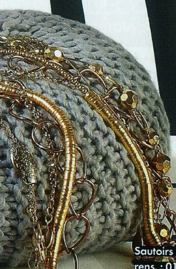
Coussin tricoté, 45 €, Winkler, rens. : 03 88 79 50 60.