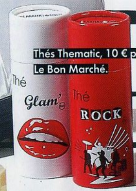
Thés Thematic, 10 € pièce, Le Bon Marché.