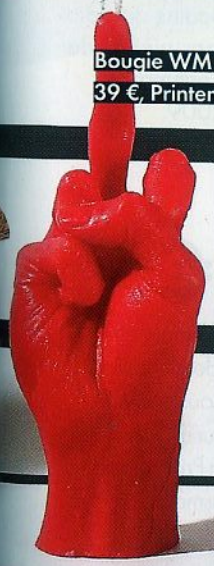
Bougie WM moulée sur main, 39 €, Printemps Haussmann.