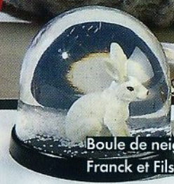
Boule de neige, 8 €, Franck et Fils, Paris-16 e .