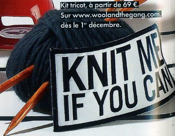
Kit tricot, à partir de 69 €. Sur www.woolandthegang.com, dès le 1 er décembre.