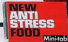
Mini-tablette de chocolat, 4 €, Colette, Paris-1 er .