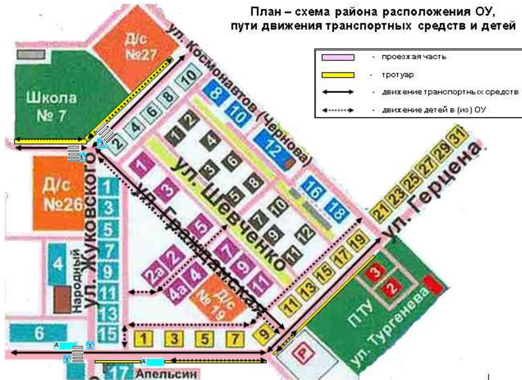
План – схема района расположения ОУ, пути движения транспортных средств и детей