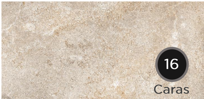
POR ESM PORTO ALMOND ANTI-SLIP NTL1215L85CG20060