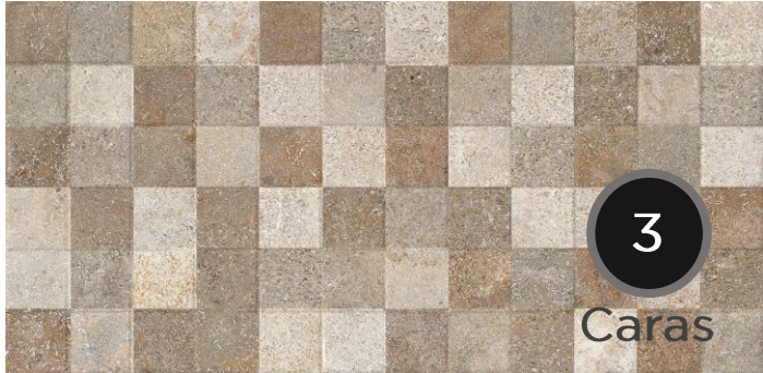
POR ESM PORTO DECOR ALMOND NTL1215L85CG20120