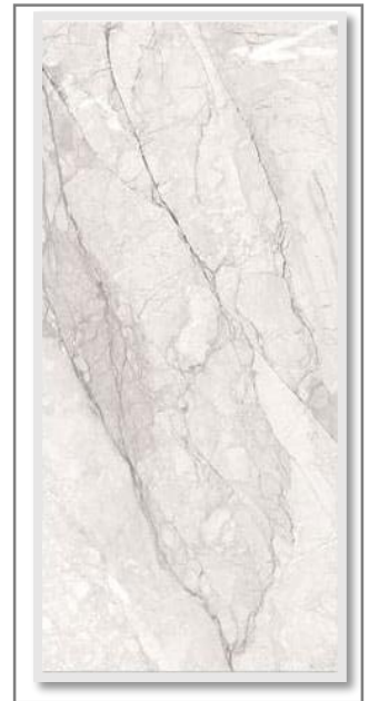
GRES ESM LUMINI PULIDO 60X120 RT FGR1212R50EL60080