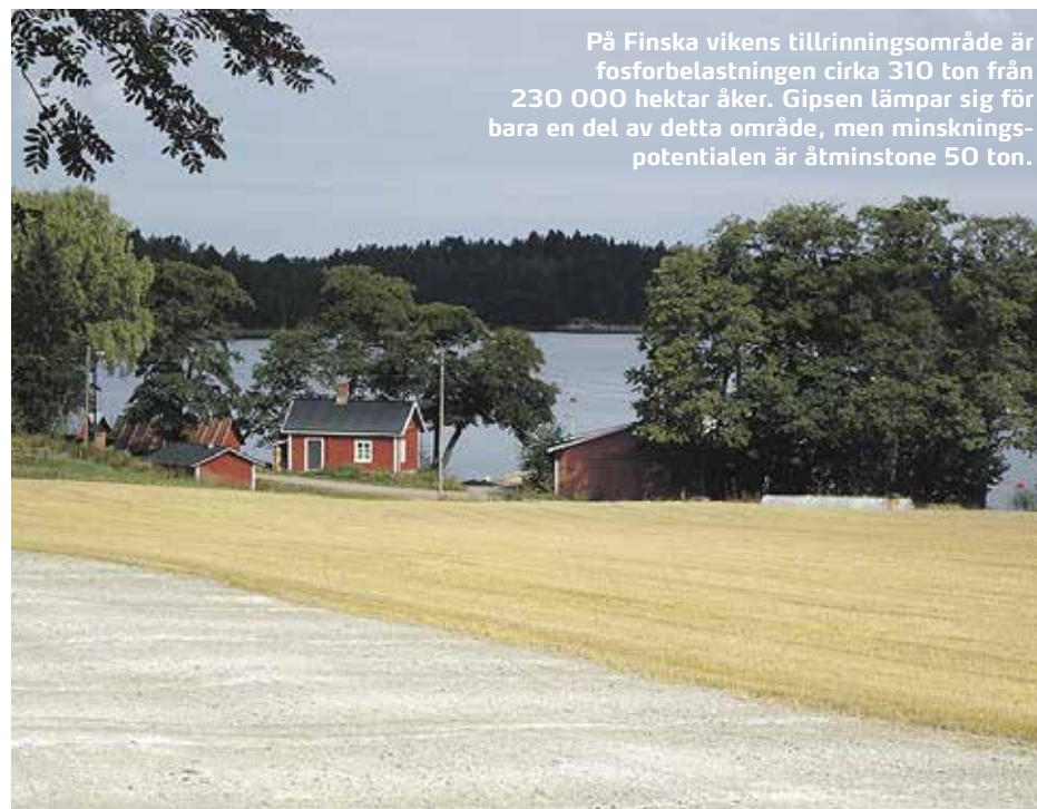
På Finska vikens tillrinningsområde är fosforbelastningen cirka 310 ton från 230 000 hektar åker. Gipsen lämpar sig för bara en del av detta område, men minskningspotentialen är åtminstone 50 ton.

Priset är åtminstone inte orsaken. I Nurmijärvi genomförde vi en anbudstävling där jordbrukarna var villiga att sprida gips (4 ton/ha) till en genomsnittlig hektarersättning om 220 euro. Om gipsens utlakningsminskande effekt fortgår i fem år blir priset per kilogram för minskningen grovt beräk-