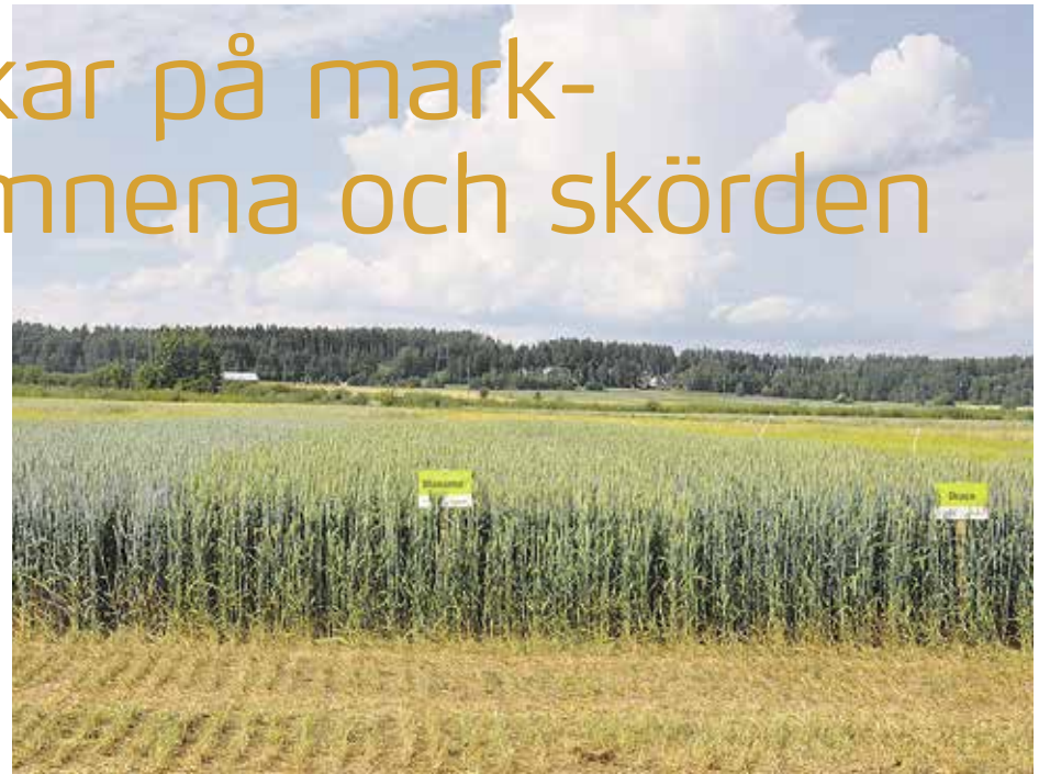
Bearbetningsförsöket har utförts på Kotkaniemi forskningsstation från år 2003. Under de första åren gav det plöjda området bäst skörd, under de senaste åren har stubbearbetning och direktsådd gett de bästa skördarna. Med stubbearbetning har medeltalet av fyra års skörd av vårvete uppgått till 6 580 kg/ha.

I mitten av juli i fjol uppmättes mängden lösligt kväve i de ogödslade remsorna som bearbetats med olika metoder. Mätningarna visade att mängden lösligt kväve i den plöjda ogödslade remsan var minst, 8,6 mg/l. I reducerad bearbetad jord fanns det 11,9 mg lösligt kväve/l och i direktsådd jord 14,7 mg/l.