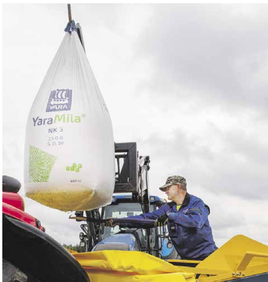
Yara ger kvalitetsgaranti åt sina gödselmedel. Tack vare granulatets höga fysiska kvalitet får man en jämn gödselspridning.

Det lönar sig att planera odlingen av högavkastande höstspannmål och höstraps så att en del av fosfor- och kaliumgödslingen ges först i samband med vårgödslingen. Ett lämpligt gödselmedel för vårgödsling är YaraMila Y 1. YaraMila Finlandssalpeter som ges på sommaren säkrar en stor skörd och hög proteinhalt.