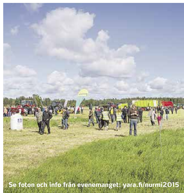
Se foton och info från evenemanget: yara.fi/nurmi2015

E venemanget Nurmi 2015 gick av stapeln den 13 augusti i Ylivieska. Temat för utställningen var Ta mått av skörden. Som huvudarrangörer för evenemanget fungerade Yara Suomi, Agrimarket och K-lantbruk. Fler än 30 aktörer inom vallsektorn medverkade med egna avdelningar. Nästan 5 000 jordbrukare deltog i evenemanget.