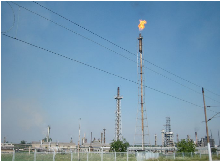
Rafinerija nafte u Sisku, Hrvatska/INA

Internacionalne financijske institucije bile su usredotočene na to da osiguraju potpunu privatizaciju javnih dobara Hrvatske – dajući prednost takozvanoj tranziciji na tržišno-orijentiranu ekonomiju – posvećujući vrlo malo pažnje tome tko će stvarno imati koristi od takve privatizacije . Drugim riječima: hoće li to pomoći transformaciji države, udaljavanju od „ortačkog kapitalizma“ prethodnog perioda? Hoće li privatizacija biti praćena povećanom javnom kontrolom i