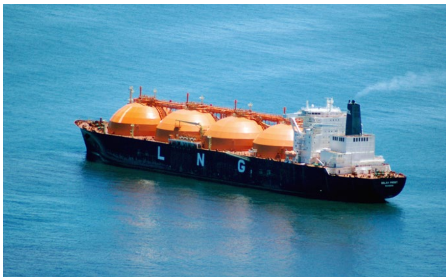
“Golar Frost”, Slika (c) Lens Envy. Flickr, CC BY-NC-ND 2.0

Primjerice, plan koji je investitorima predstavio bivši direktor LNG-a Hrvatska Goran Frančić prije nekoliko godina, samo spominje offshore postrojenje 53 . Međutim, opis projekta predstavljen Europskoj komisiji – koji je bio uključen u prvi popis „Projekata od zajedničkog interesa“ 2013. godine – i sljedeća verzija uključena u Desetogodišnji plan razvoja mreže EU-a 2015. godine upućuje na to da je plan bio graditi offshore postrojenja.