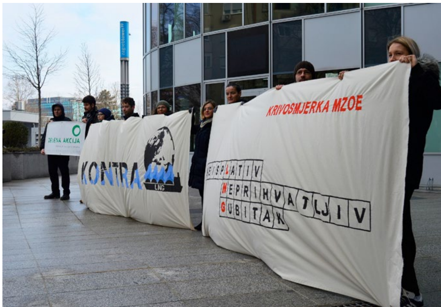
Akcija kontra LNG-a u Zagrebu o užujku 2018.

za transport plina do spoja s međunarodnim interkonektorom prema Mađarskoj. No, Nacional ističe da usvajanje zakona o LNG-u de facto omogućuje LNG Hrvatska da zatraži zemljište za izgradnju prve i druge faze projekta. Navodno, tvrtka je poduzela korake kako bi nastavila s izvlaštenjem, potezom koji je izazvao napetosti s Gasfinom Sa, stranim ulagačem koji je upravo kupio Dioki (vidi: Tko je Gasfin).