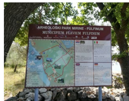
Arheološko nalazište u blizini industrijskog postrojenja Dioki u Omišlju.

bi pridonio diversifikaciji energije u središnjoj i istočnoj Europi, gdje je Rusija glavni opskrbljivač plinom. U raznim prilikama Mađarska je isticala svoj interes za kupnju plina iz očekivanog postrojenja na Krku. Na početku listopada 2018., mađarski ministar vanjskih poslova i trgovine, Peter Szijjarto, sastao se u Budimpešti s Tomislavom Čorićem, hrvatskim ministrom okoliša i energetike, kako bi razgovarali o zajedničkim energetske projektima i opskrbi plinom. Tom prilikom je Peter Szijjarto dao izjavu za medije da je hrvatski LNG terminal važna prilika za Mađarsku da diversificira svoju opskrbu energijom nakon 2020., kada ističe njihov dugogodišnji ugovor s Rusijom o opskrbi plinom 44 .