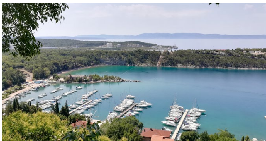
Pogled na zaljev i industrijsko postrojenje Dioki u Omišlju.

U središtu Sanaderove priče je navodno mito od 10 milijuna eura koje je Ivo Sanader uzeo od mađarske energetske tvrtke MOL kako bi omogućio povoljne uvjete za kupnju većinskog udjela u hrvatskoj energetske tvrtki INA, kao dio procesa privatizacije.