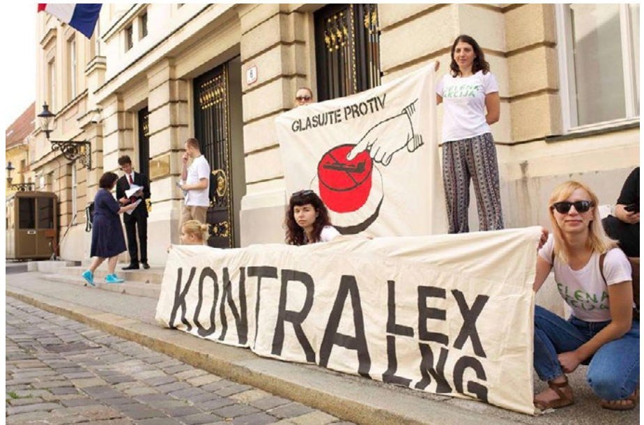
Zelena akcija u Zagrebu poziva Hrvatski sabor da odbaci Zakon o LNG-u.

bogatstvo upleteno u navodno korumpirane poslove i sistemsku korupciju. Paralelno s tim, s realpolitičkim pristupom, druga ministarstva iste Vlade poduzela su korake kako bi osigurala da LNG postrojenje koje je predložio Ježić ugleda svjetlo dana u svakom slučaju .