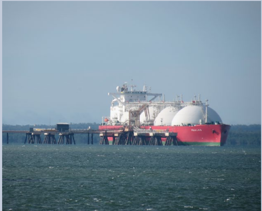
LNG prijevoznik Fuji Lng

Predloženo financiranje je značajno: 339 milijuna eura.