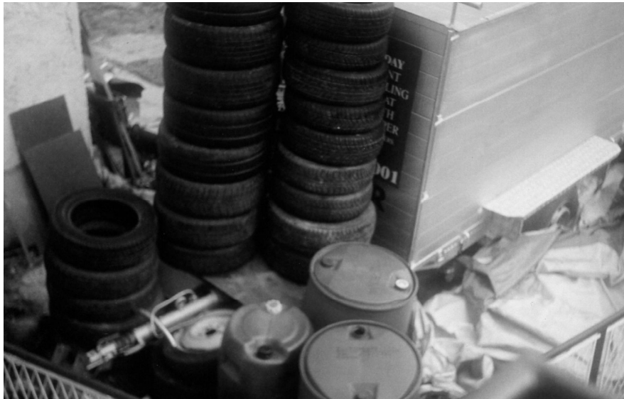
OTPAD U PRIJEDORSKOJ ULICI