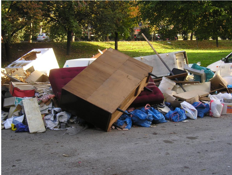
Deponij na Sigečici