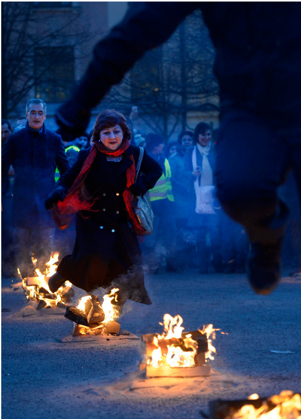
Eldfesten, den stora höjdpunkten under det persiska nyåret, lockar allt fler för varje år. Firandet på Skansen i Stockholm samlar omkring 30 000 personer och direktsänds på TV.